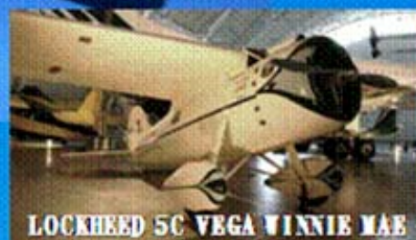
LOCKHEED 5C VEGA WINNIE MAE