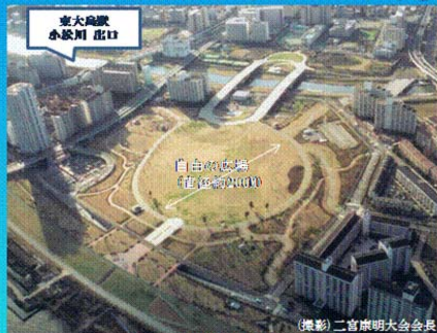
(撮影) 二宮康明大会会長